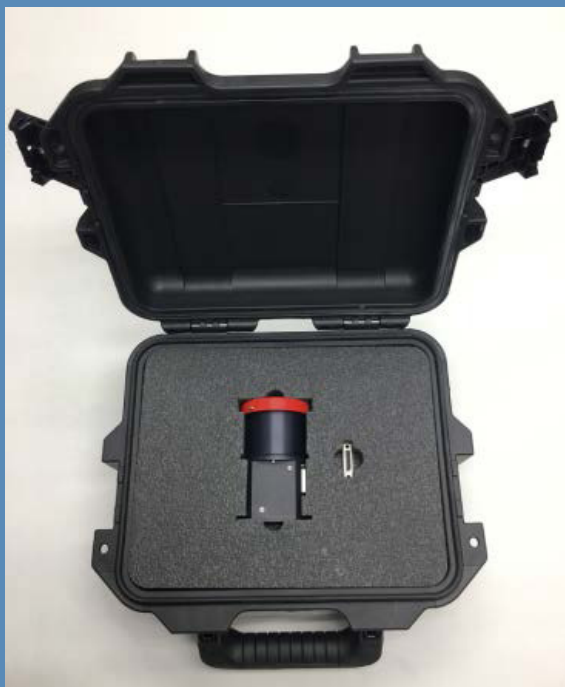
Рис. 2. МЗД АЗДК-1 в присвоенной таре

МЗД АЗДК-1 является оптимальным решением для нано и микроспутников по массо-габаритным характеристикам, энергопотреблению и стоимости. Стоимость МЗД АЗДК-1 составляет 2.5 млн. руб.